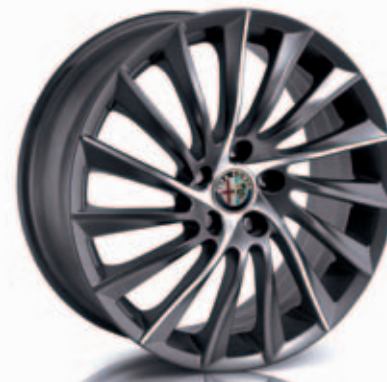
Turbina Titanio Optie 55E