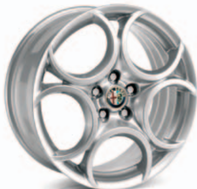
Sport 8C Competizione Standaard in Pack Sport 3 (optie 5RJ)