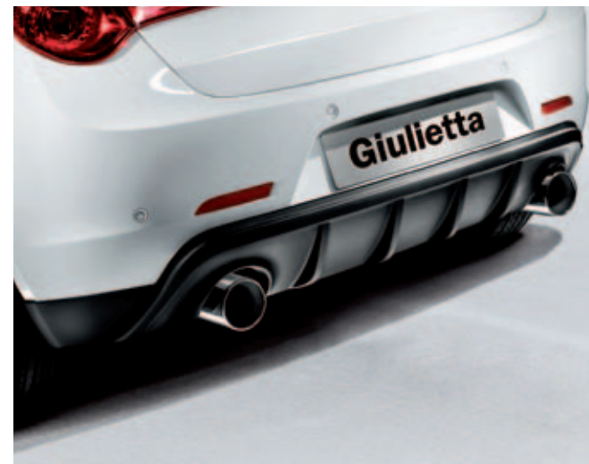
Diffuser achter i.c.m. uitlaatsierstuk DIS. 50903516 en 50903312