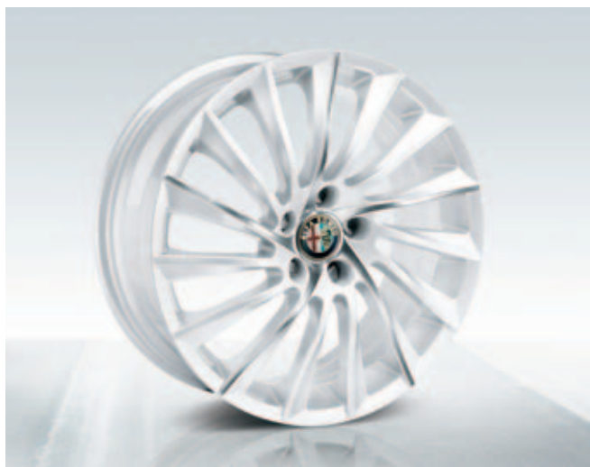
Lichtmetalen velgen 18" Turbina (wit met zilver) DIS. 50903314