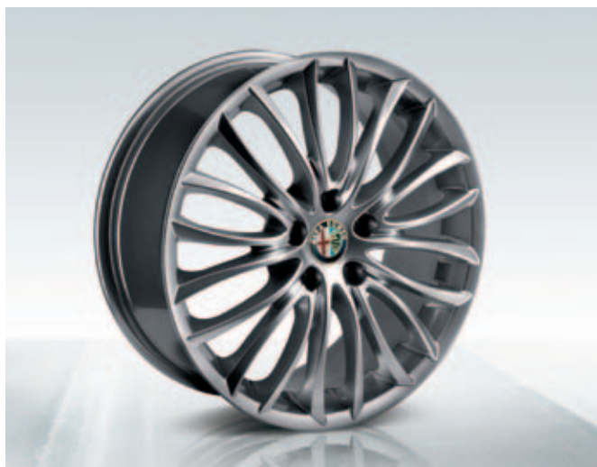
Lichtmetalen velgen 18" Sport 8C Spider (licht of donker) DIS. 50903313