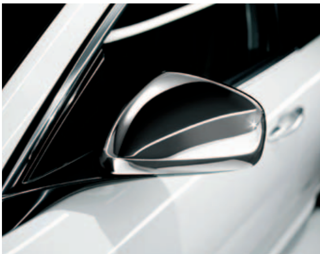
Buitenspiegelkappen chrom DIS. 50903297