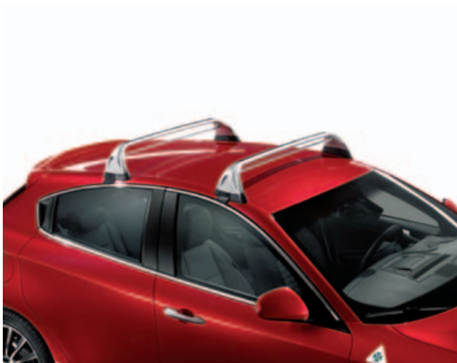
Dakdragers DIS. 50903328