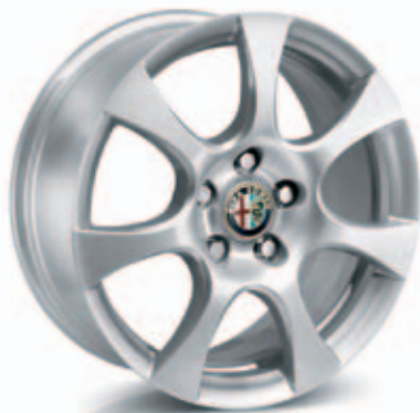
Elegante Optie 431