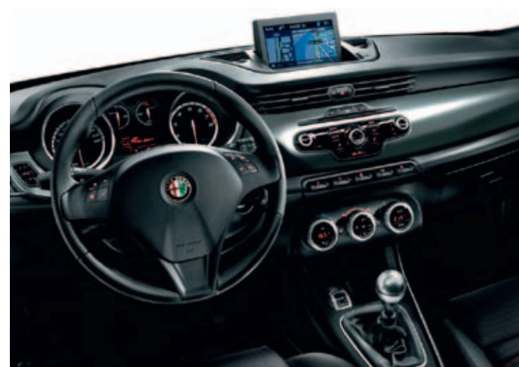
Dashboard donker geborsteld aluminium (standaard i.c.m. Pack Sport 2 of 3 en op QV)