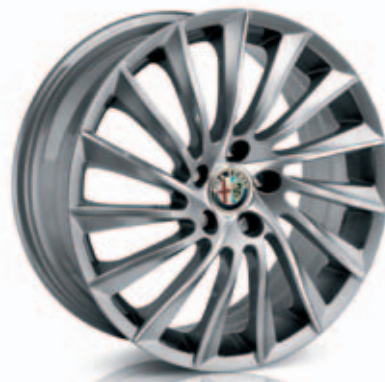
Turbina Alternatief in Pack Sport 3 (optie 5RH)