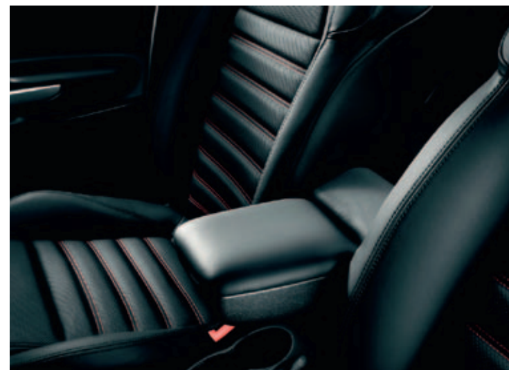
Volledig lederen bekleding in combinatie met Pack Sport 2 of 3 (optie 212)