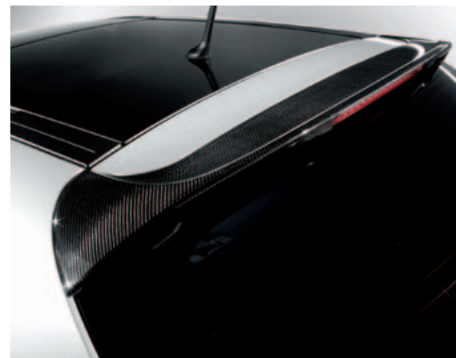
Achterspoiler carbon DIS. 50903308